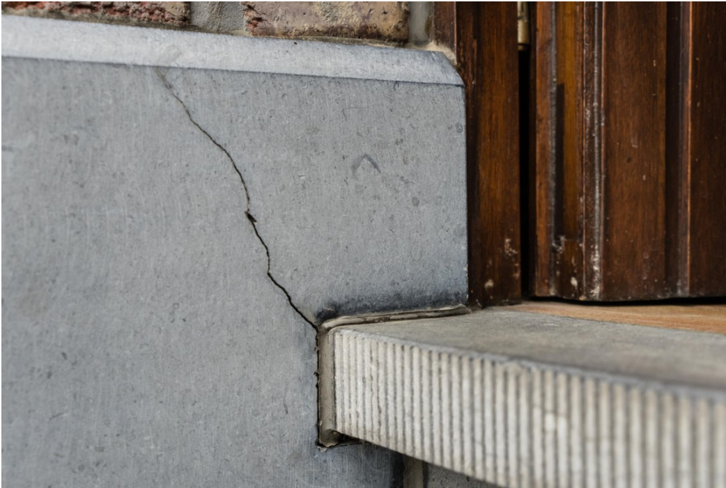
<p>Scheuren in de muur: dit is Heers. </p>