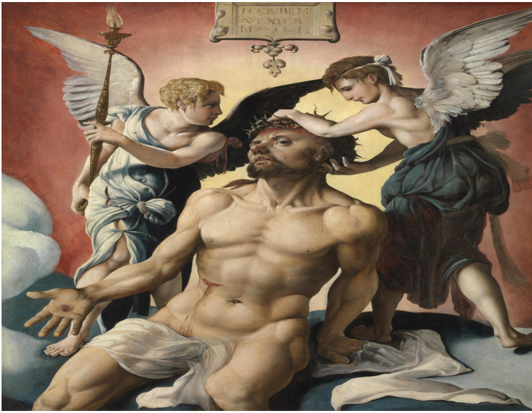
Maarten van Heemskerck, De man van smarten , 1532. MSK, Gent

Maarten van Heemskerck, De man van smarten , 1532.